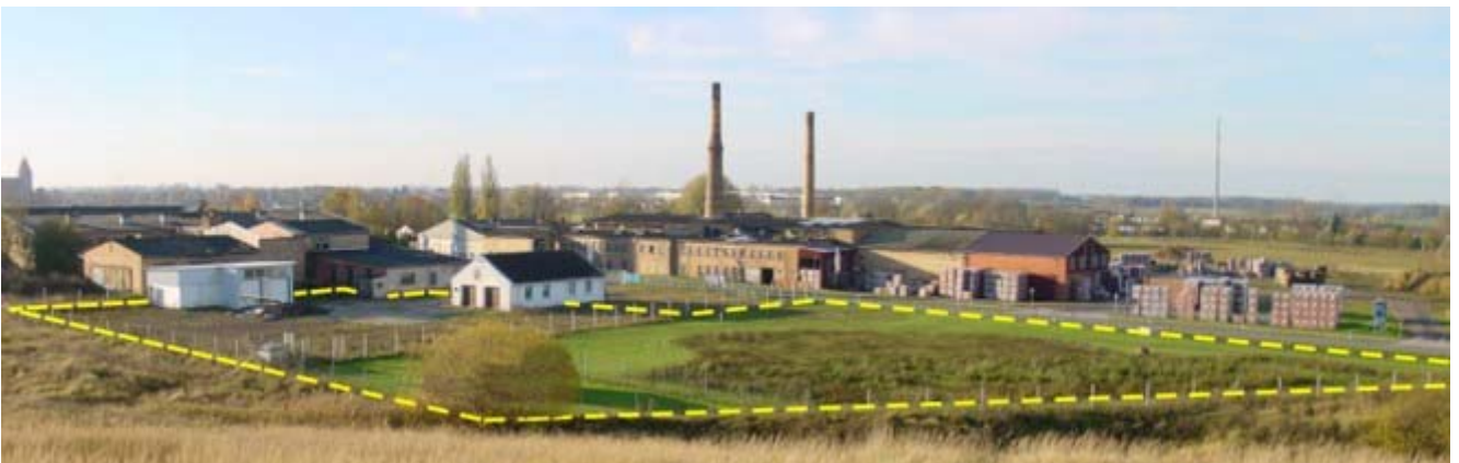
Panoramablick auf das gesamte Grundstück